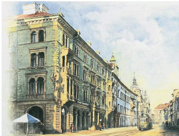
Die Generaldirektion der Grazer Wechselseitigen gehört genauso zum Stadtbild wie das Landezugehaus, mit dem sie sich eine Mauer teilt

Der Baum ist denkmalgeschützt, denn er wurde zu Ehren eines besonderen Gastes gepflanzt: Kaiser Franz Joseph I ließ sich die Eröffnung der Generaldirektion nicht entgehen. Sein Großvater, Franz I, war es, der im Jahr 1828 die Gründung der Grazer Wechselseitigen durch Erzherzog Johann erlaubte. Der Erzherzog nimmt seither eine bedeutende Rolle in der GRAWE ein. Denn seine Haltung und seine Werte sind bis heute zeitgemäß. So ist ein Zitat des steirischen Modernisierers heute noch Leitpruch des Unternehmens: „In der Eintracht vieler liegt die Kraft, die das Gute bewirkt. Dazu beizutragen ist eines Jeden Aufgabe“.