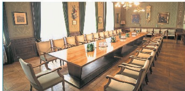
Bild links: Im Sitzungssaal in der GRAWE-Generaldirektion fühlt man sich zurückversetzt in Kaisers Zeiten.

Immobilien und Banken erfolgreich aufgestellt ist. Starke Wurzeln, die womöglich noch lange über die heute erreichten 190 Jahre hinaus tragen werden. Schließlich ist die Linde ein Baum, der auch 1000 Jahre alt werden kann.